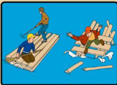
НЕ ИСПОЛЬЗУЙТЕ ДЛЯ ПЛАВАНИЯ САМОДЕЛЬНЫЕ УСТРОЙСТВА! ОНИ МОГУТ НЕ ВЫДЕРЖАТЬ ВАШ ВЕС И ПЕРЕВЕРНУТЬСЯ!