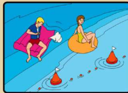
НЕ ЗАПЛЫВАЙТЕ ДАЛЕКО ОТ БЕРЕГА НА НАДУВНЫХ МАТРАСАХ И АВТОМОБИЛЬНЫХ КАМЕРАХ!