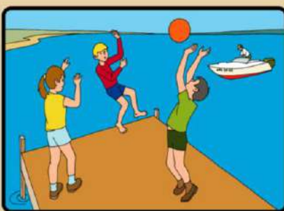
НЕ СТОЙ И НЕ ИГРАЙ В ТЕХ МЕСТАХ, ОТКУДА МОЖНО СВАЛИТЬСЯ В ВОДУ!

Безопасность поведения на воде. Главное условие безопасности купаться в сопровождении кого-то из взрослых. Необходимо объяснить ребенку, почему не следует купаться в незнакомом месте, особенно там, где нет других отдыхающих. Дно водоема может таить немало опасностей: затопленная коряга, острые осколки, холодные ключи и глубокие ямы. Прежде чем заходить в воду, нужно понаблюдать, как она выглядит. Если цвет и запах воды не такие, как обычно, лучше воздержаться от купания. Также дети должны твердо усвоить следующие правила: игры на воде опасны (нельзя, даже играючи, "топить" своих друзей или "прятаться" под водой); категорически запрещается прыгать в воду в не предназначенных для этого местах; нельзя нырять и плавать в местах, заросших водорослями; не следует далеко заплывать на надувных матрасах и кругах; не следует звать на помощь в шутку.