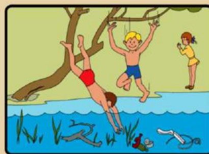
НЕ НЫРЯЙТЕ В НЕЗНАКОМЫХ МЕСТАХ! НЕ ИЗВЕСТНО, ЧТО ТАМ МОЖЕТ ОКАЗАТЬСЯ НА ДНЕ!