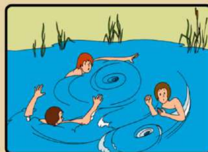
НЕ БОРИТЕСЬ С СИЛЬНЫМ ТЕЧЕНИЕМ! ПЛЫВИТЕ ПО ТЕЧЕНИЮ ПОСТЕПЕННО ПРИБЛИЖАЯСЬ К БЕРЕГУ!